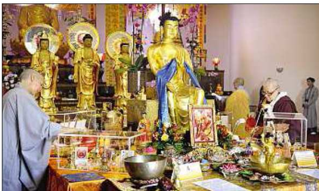
SYMBOLES. Lors de la mise en place des reliques, au centre bouddhiste de Rancon.

« Se prosterner devant ces reliques revient à se prosterner devant le Bouddha lui-même », expliquait Minh-Tho, repré-